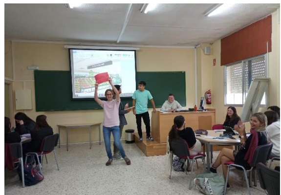
Imágenes 4 y 5. Alumnado del Grado de Educación Primaria poniendo en práctica sus dramatizaciones sobre CNV.