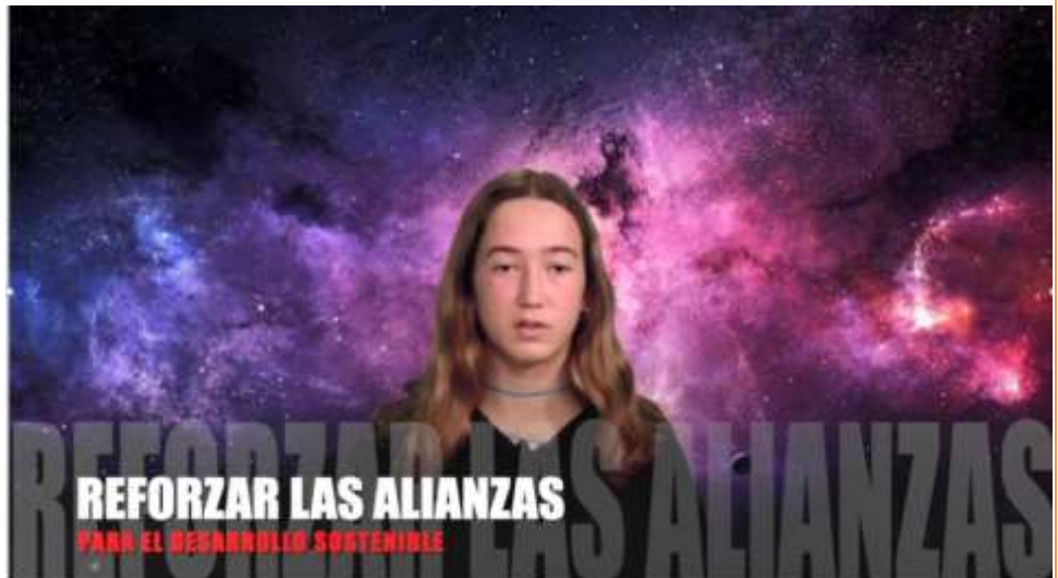
Foto: Gamers explicando las pruebas relativas a la puerta Alianzas

Tras el discurso, el noticiero queda interrumpido por los gamers y la clase se oscurece, bajando las persianas si es posible, y empieza el juego, el cual consiste en abrir 5 puertas, una por cada eje estratégico. Para ello, la clase se divide en 5 grupo, cada uno adoptará un rol en función al eje que ha de representar y liderará una prueba, adaptada a su nivel de estudios, por lo que las pruebas son diferentes para los estudiantes de secundaria que para los estudiantes de universidad.