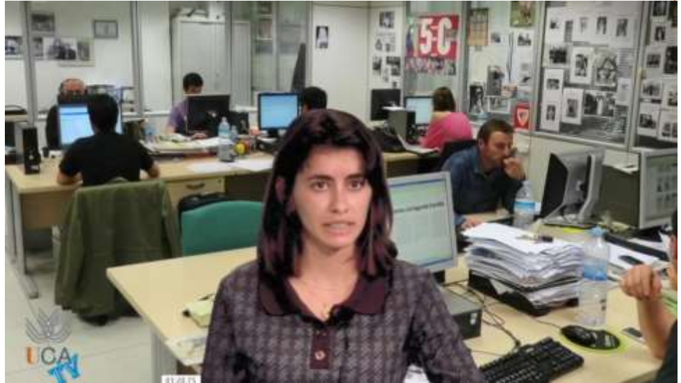
Foto: Sala de corresponsal donde se anuncian las medidas tomadas por empresas de diferentes sectores económicos

Las pruebas están diseñadas para despertar el espíritu crítico del estudiante adaptado al grupo de edad, en este sentido se han diseñado las siguientes: