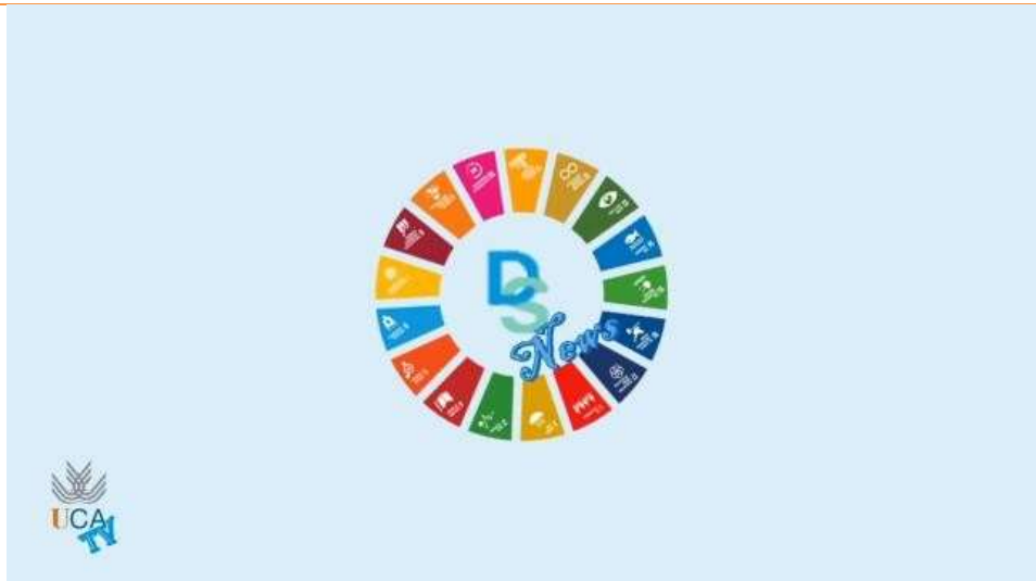
Foto: Cabecera del noticiario