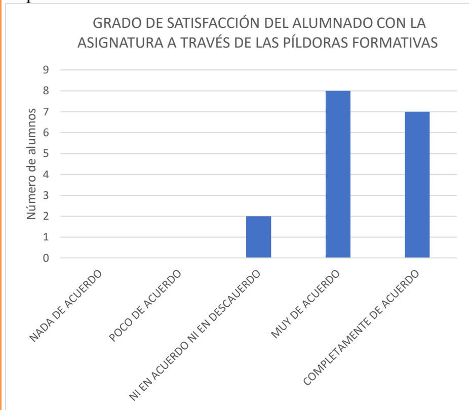
Gráfico 3. Grado de satisfacción del alumnado con la asignatura a través de las píldoras formativas.

Por tanto, se ha alcanzado el objetivo previsto.