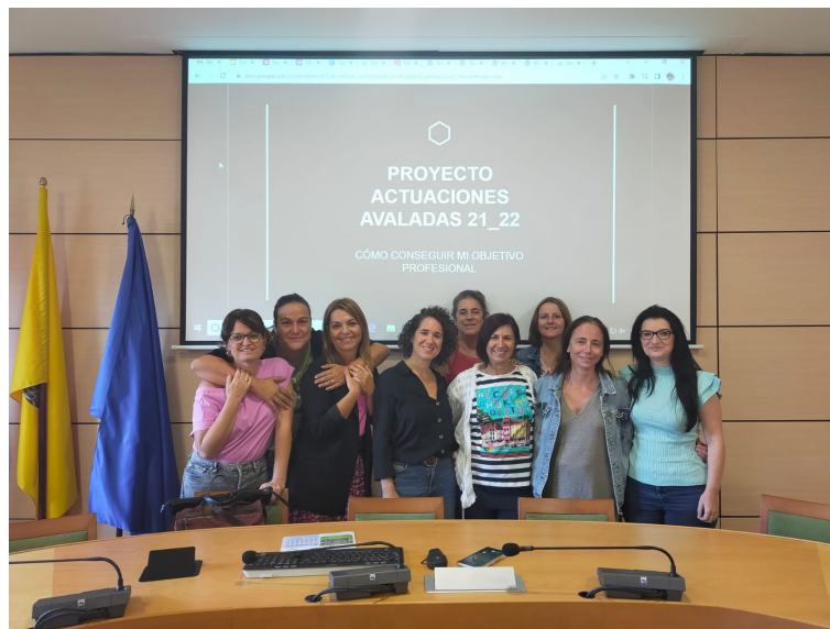
Figura 2. Exposición de resultados del proyecto al profesorado implicado en la Facultad de CCE.