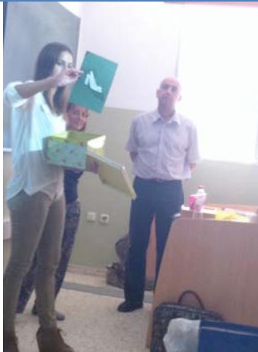
Imagen 9. Visita de dos docentes y una madre a una de nuestras asignaturas