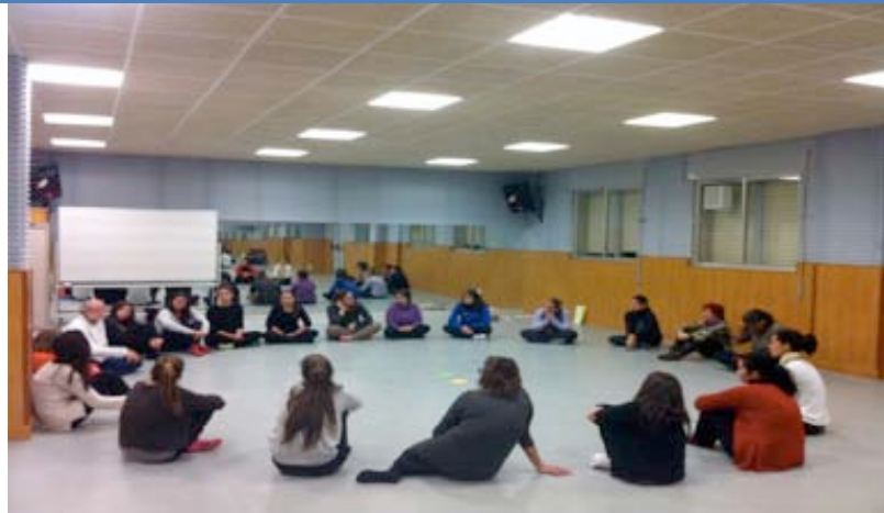
Imagen 6. Taller de trabajo con emociones en el aula

- El segundo taller realizado fue sobre cómo trabajar las matemáticas de forma manipulativa en infantil, a través de regletas de Cuisenaire. Uno de los maestros implicado en la RED trabaja así con su alumnado de Infantil, lo cual pareció interesante al resto del equipo. Por lo que se desarrolló este taller, al que además de los participantes en el proyecto asistieron otros compañeros de la Facultad (como fue el caso de los profesores del área de Didáctica de las Matemáticas), así como estudiantes del Grado de infantil que mostraron interés por el mismo. A raíz de ello, este curso un grupo de alumnas de cuarto del grado de infantil nos está demandando que volvamos a ofrecer este taller.