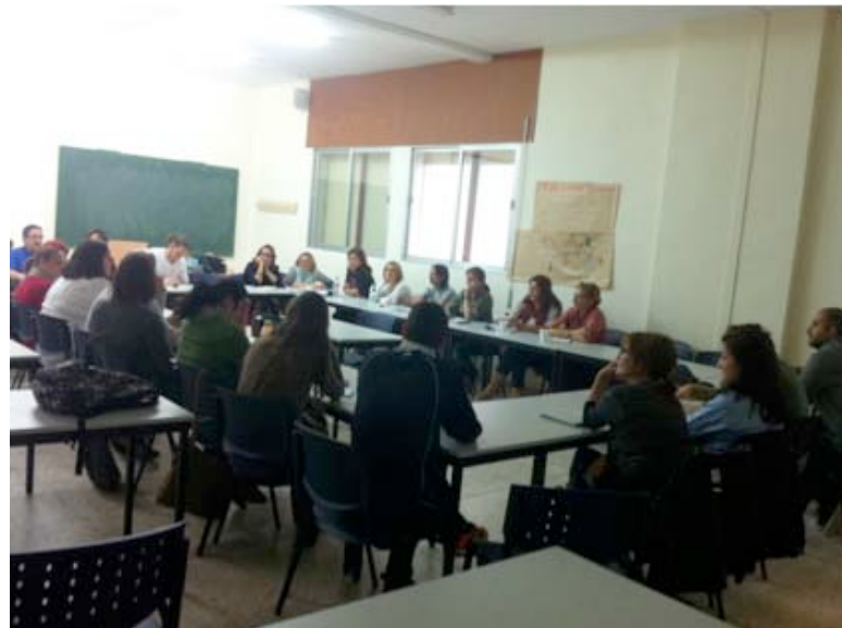
Imagen 5. Segundo encuentro de “café con pastas”

Resulta importante destacar que para ello el equipo de maestras del CEIP Viento del Sur, nos pidió colaboración a la Facultad de Educación, de modo que desde ésta nos pareció interesante vincular el Proyecto, al trabajo que estábamos realizando algunos de los profes en la asignatura de Innovación, “el proyecto educativo 1” en Infantil (se explica este resultado en el objetivo 5).