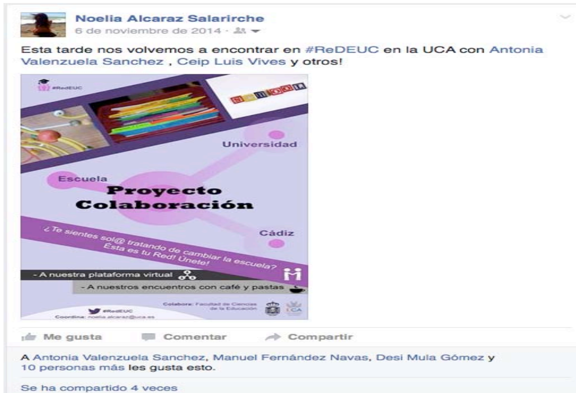
Imagen 14. Estado de facebook anunciando uno de los encuentros