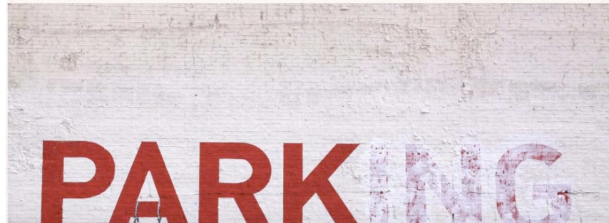
Imagen 2. Web del CEIP Luis Vives, anunciando la participación de dos profesores del Proyecto en una quincena de asambleas dialógicas