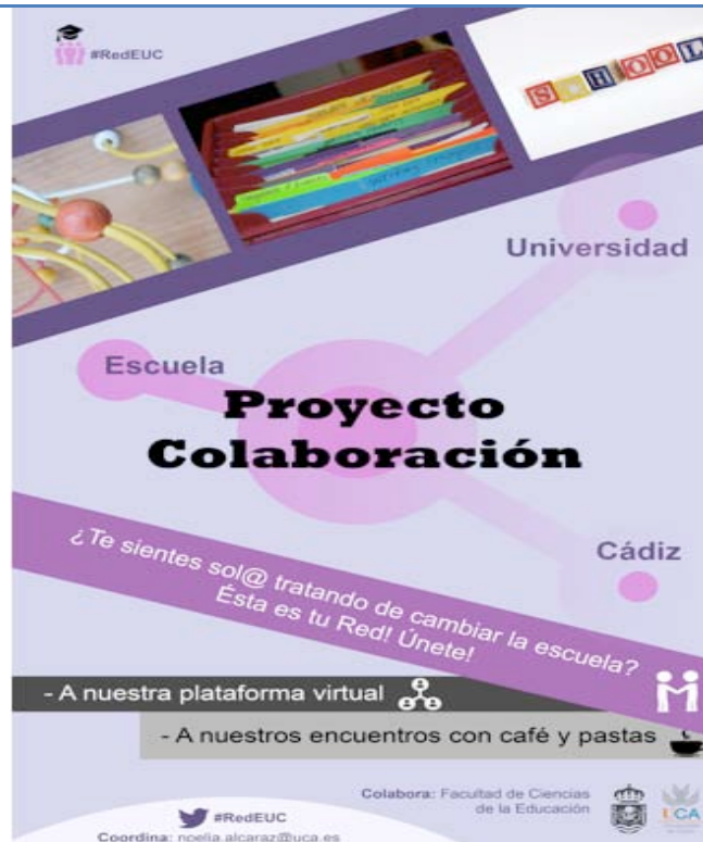
Imagen 1. Cartel informativo sobre la creación de la RED

A través de este llamamiento surgió también el interés de diferentes estudiantes (alumnos y ex-alumnos) que quisieron asistir a algunos de los encuentros y talleres que se realizaron. Dicha circunstancia resultó altamente interesante y muy bien valorada por el alumnado, ya que tuvo la oportunidad de ser conocedor y partícipe de las preocupaciones e intereses reales de parte del profesorado en ejercicio.