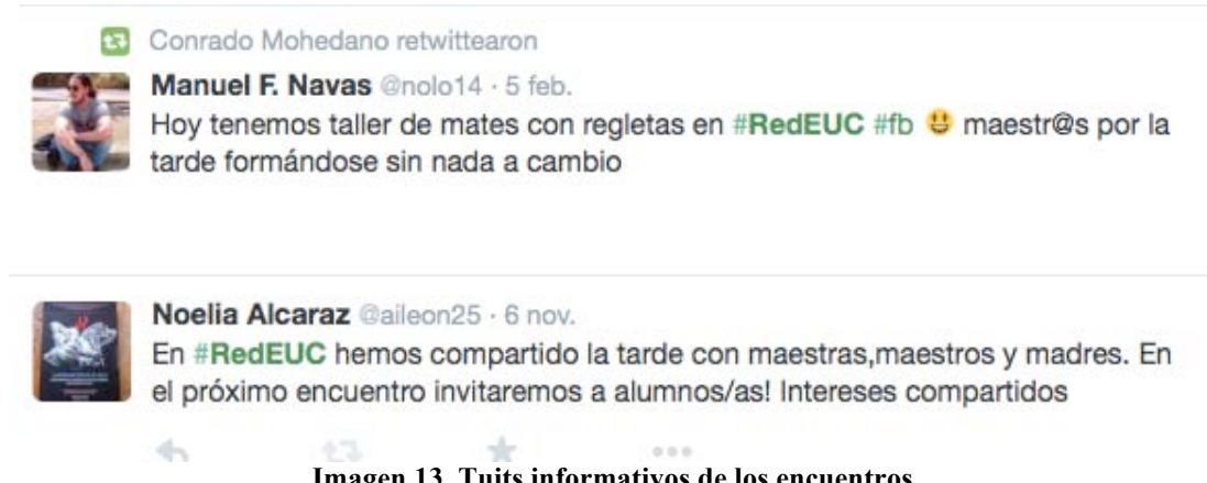
Imagen 13. Tuits informativos de los encuentros