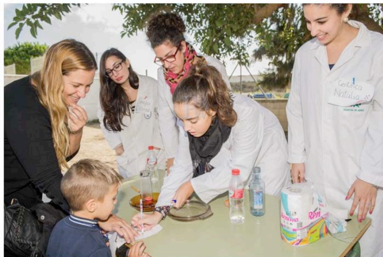
Imagen 12. Alumnas de la facultad participando en la Feria de la Ciencia (noticia publicada en Puerto Real Web).

La Escuela de Educación Infantil Viento del Sur de la barriada Río San Pedro de Puerto Real ha celebrado la "Feria de las Ciencias" en la que los alumnos, que cuentan con edades entre 3 y 5 años, han participado activamente en una actividad que pretende despertar la curiosidad científica de los pequeños a través de la experimentación. Con la ayuda de sus familiares y de los estudiantes del Campus Universitario de Puerto Real han pasado una mañana divertida.