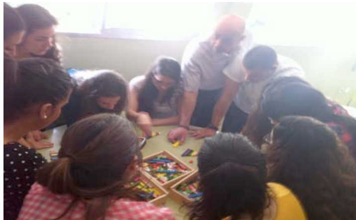
Imagen 7. Taller de matemáticas manipulativas en infantil

- El segundo taller realizado fue sobre cómo trabajar las matemáticas de forma manipulativa en infantil, a través de regletas de Cuisenaire. Uno de los maestros implicado en la RED trabaja así con su alumnado de Infantil, lo cual pareció interesante al resto del equipo. Por lo que se desarrolló este taller, al que además de los participantes en el proyecto asistieron otros compañeros de la Facultad (como fue el caso de los profesores del área de Didáctica de las Matemáticas), así como estudiantes del Grado de infantil que mostraron interés por el mismo. A raíz de ello, este curso un grupo de alumnas de cuarto del grado de infantil nos está demandando que volvamos a ofrecer este taller.