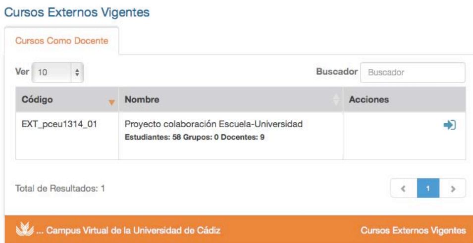
Imagen 3. Campus virtual creado para el Proyecto

Actividades realizadas y resultados obtenidos: A través de la Unidad de Campus Virtual de nuestra universidad se creó una plataforma donde fuimos dando de alta al profesorado interesado en participar en la Red de colaboración, con un total de 58 maestros/as de Centros de Infantil y Primaria y los 9 profesores de la Universidad.