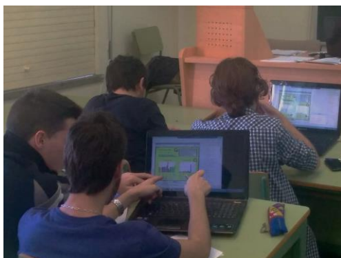
Figura 2. Ensayando la toma de decisiones en proyectos software jugando con ProDec