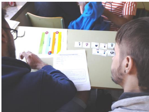
Figura 1. Aprendiendo a monitorizando proyectos software jugando a Deliver!