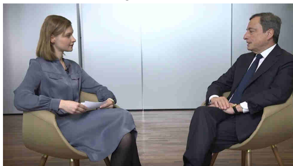
Figura 3. Ejemplo video-entrevista a Mario Draghi, presidente del BCE para explicar el concepto de política monetaria.