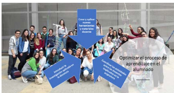
Figura 1 Presentación de los objetivos de la innovación docente

Se propusieron los siguientes objetivos: crear y aplicar nuevas herramientas y materiales docentes; coordinar las actividades entre las docentes implicadas en la asignatura, e, introducir la investigación aplicada en la docencia. Todos ellos tratan centrar su atención en la innovación en la docencia en el aula, en optimizar el proceso de aprendizaje en el alumnado para facilitarles la coordinación y devolución de conocimientos aprendidos a la Sociedad. Elementos fundamentales en esta estrategia de innovación.