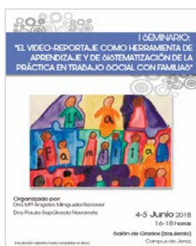
Figura 2 Seminario: visualización y puesta en común de los video reportajes.

Formalmente los objetivos se cumplieron: se elaboraron 17 video-reportajes. Se realizó un seminario llamado “El video-reportaje como herramienta de aprendizaje y de sistematización de la práctica en Trabajo Social con familias” (Figura 2), como espacio de aprendizaje colaborativo y de reflexión, alumnado ↔ docentes, a partir del visionado y análisis de los videos-reportajes realizados. En el que participaron tanto el alumnado sujeto de la innovación así como un grupo numeroso del resto de cursos del grado Trabajo Social.