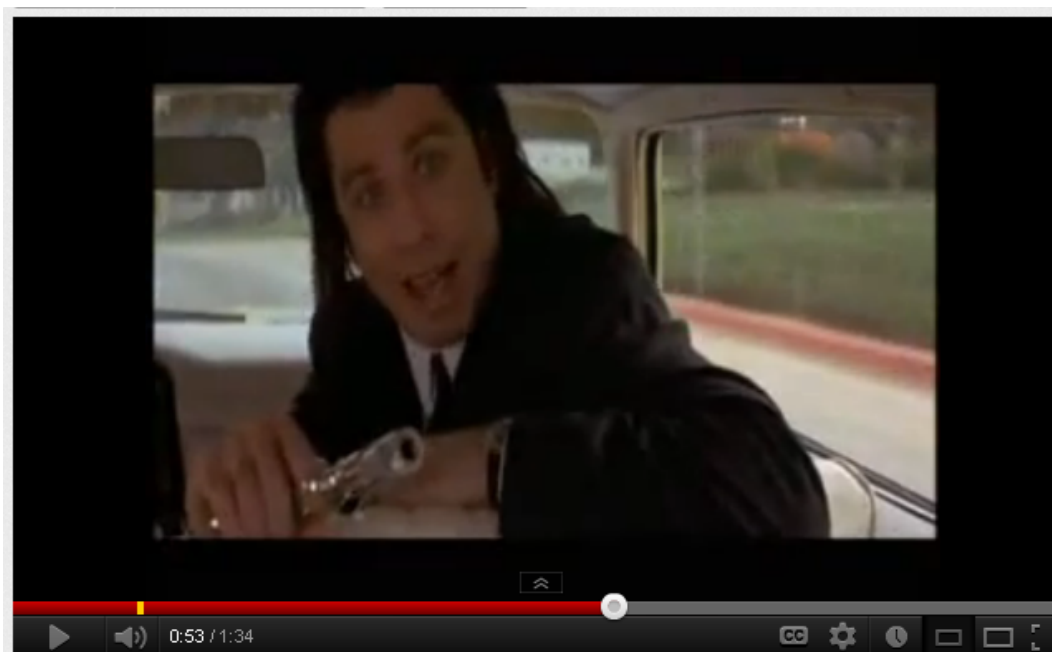
Pulp Fiction (Marvin shot): Homicidio imprudente