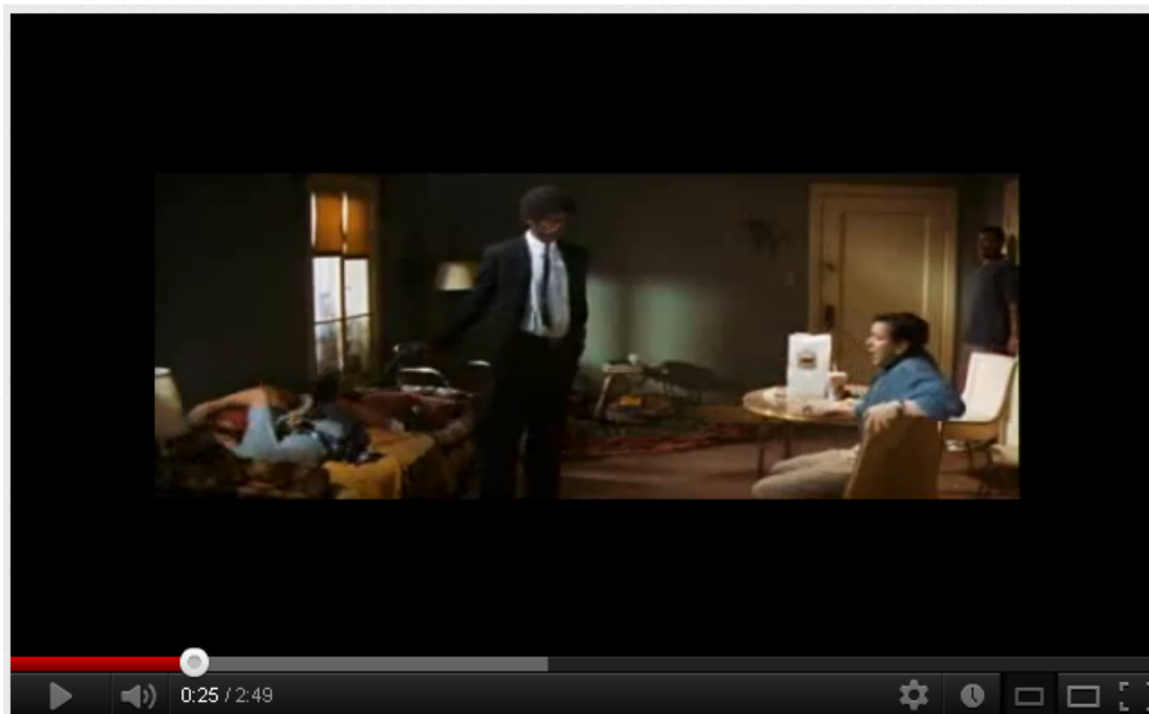
Pulp Fiction (Ezequiel, 25:17): Asesinato