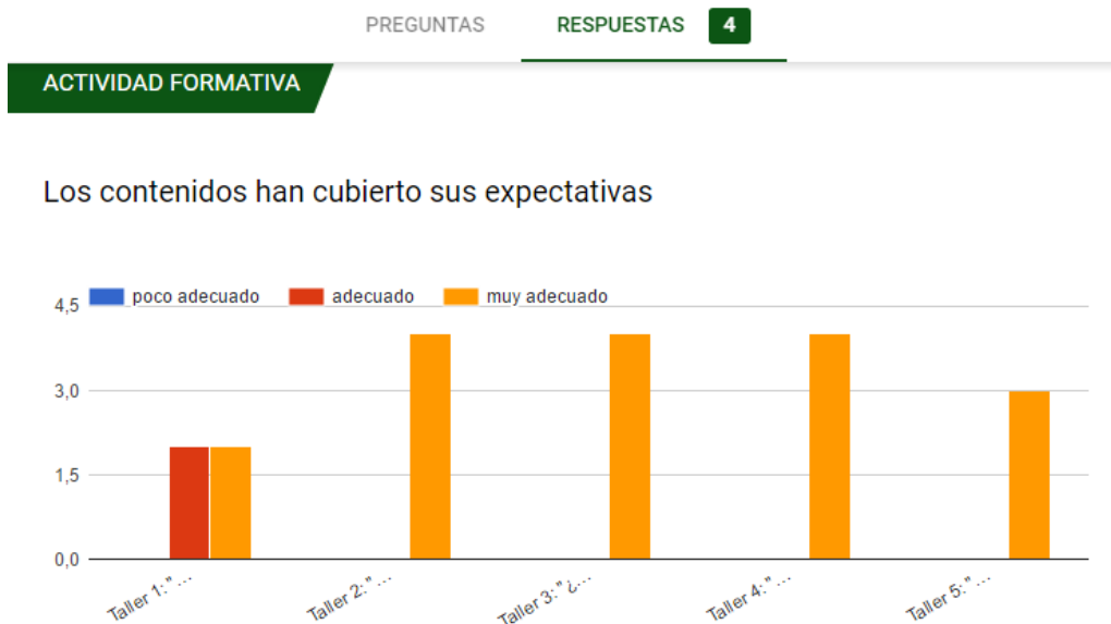
Figura 1.- Resultados de la encuesta de satisfacción sobre si los contenidos tratados en cada uno de los talleres han cubierto sus expectativas.

Como se puede observar en las figuras, los alumnos consideraron con un alto grado de adecuación que los contenidos de los talleres habían cubierto sus expectativas, principalmente los talleres 2,3 y 4 (Figura 1).