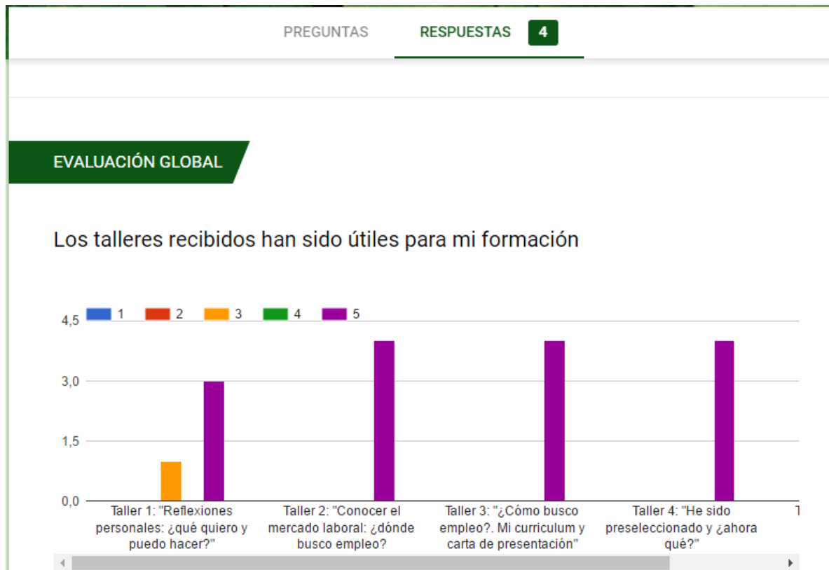
Figura 4.- Resultados de la encuesta de satisfacción sobre la utilidad de los talleres

También consideraron como muy útiles los talleres realizados dentro esta Actuación Avalada (Figura 4) y valoraron muy positivamente el proyecto (Figura 5) sugiriendo que fuera impartido no sólo para los últimos cursos sino para cursos anteriores.