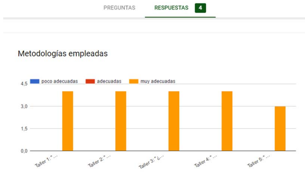
Figura 2.- Resultados de la encuesta de satisfacción sobre las metodologías empleadas en cada uno de los talleres

Igualmente, las metodologías empleadas (Figura 2) y los materiales y herramientas aportados para cada taller (Figura 3) fueron considerados como muy adecuados para todos los talleres.