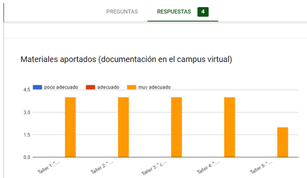
Figura 3.- Resultados de la encuesta de satisfacción sobre los materiales aportados en cada uno de los talleres