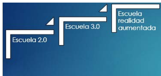
Figura 2. La aplicación de las tecnologías en la escuela

Concretamente en el Grado de Magisterio, nos cuestionamos si realmente los estudiantes están recibiendo una formación en tecnologías aplicadas a la educación teniendo en cuenta que ya hemos superado la escuela 2.0 y 3.0, ahora hablamos de realidad aumentada. En las recientes Jornadas sobre tecnología en Bruselas (2015), se habló de aprendizaje móvil. Tendencia que está calando en las escuelas europeas hasta el punto que la UNESCO ha elaborado un informe donde señala las directrices para políticas de aprendizaje móvil. Ya no se habla de ordenadores, sino de segundas pantallas (Tablet y demás dispositivos con acceso a la red)