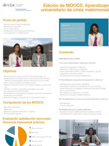
Figura 1: Comunicación escrita XI FECIES Bilbao 2014

La experiencia, metodología y resultados de la edición del MOOC "Separación y divorcio: aspectos sustantivos y procesales", han sido abordadas en una comunicación escrita y defendida en el "XI Foro Internacional sobre la Evaluación de la Calidad de la Investigación y de la Educación Superior (FECIES)", celebrado en Bilbao los días 8 a 11 de Julio de 2014.